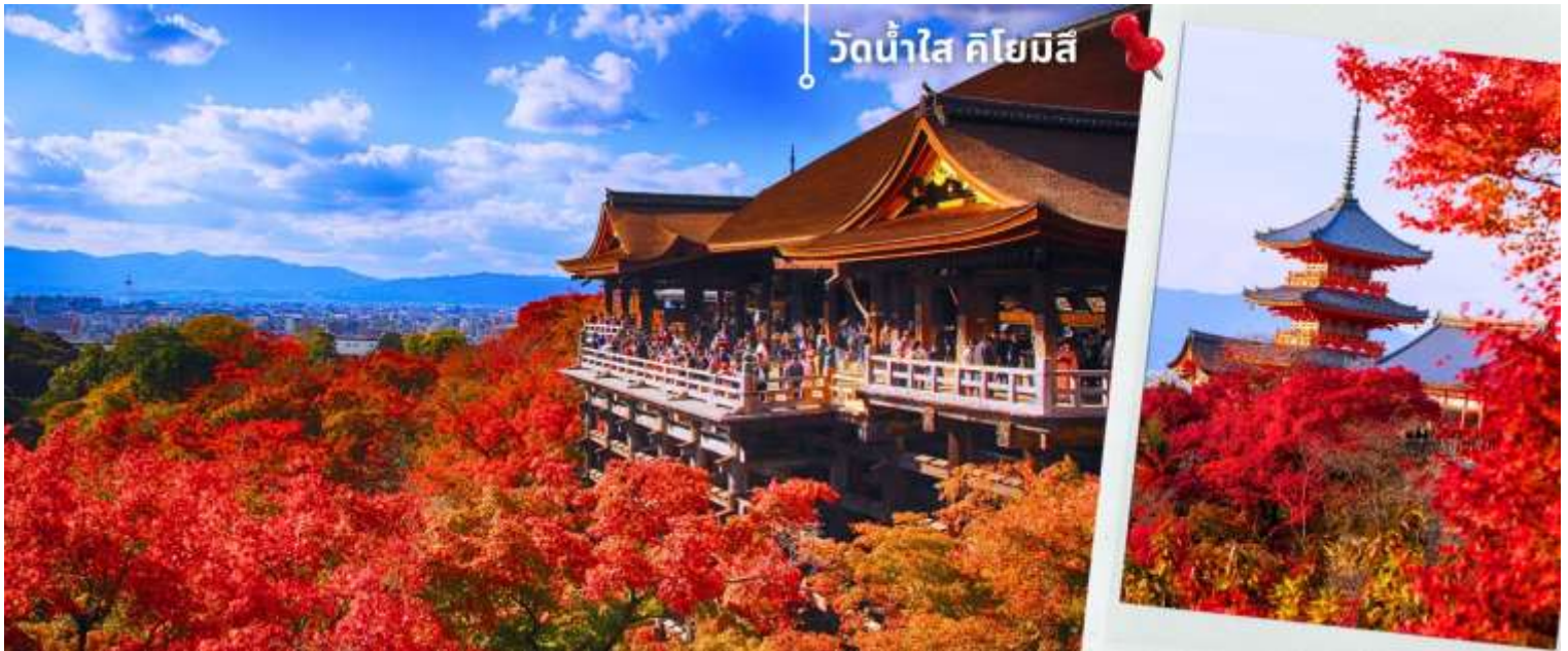
วัดน้ำใส คิโยมิสึ

*ระยะเวลาการเปลี่ยนสีของใบไม้จะขึ้นอยู่กับสายพันธุ์และสภาพอากาศ*