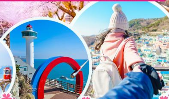
อุทยานแห่งชาติ หมู่บ้านคัมซอน

** ร่วมเทศกาลชมดอกซากุระ 2025 เมืองจินแฮ 1 ปี มีแค่ครั้งเดียวเท่านั้น **