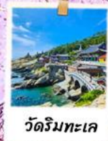
วัดริมทะเล