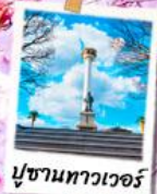
ปูซานทาวเวอร์