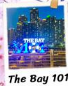
The Bay 101