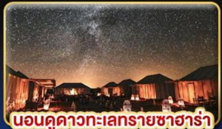
นอนดูดาวทะเลทรายซาฮารา