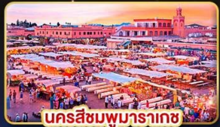
นครสีชมพูมารากะช