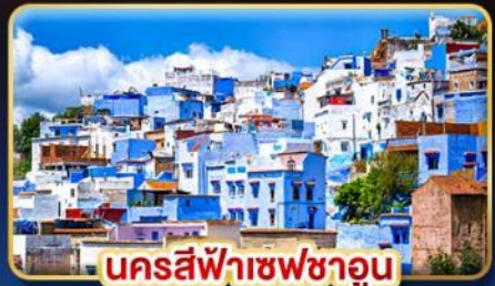
นครสีฟ้าเซฟซาอูน

ท่องเที่ยวดินแดนฟ้าจรดทราย เก็บทุกไฮไลท์ใน โมร็อกโก อารยธรรมสุดขอบทวีป