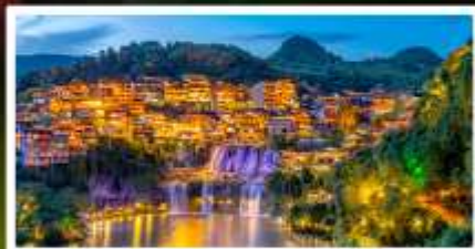
เมืองโบราณฟุทหงเจิ้น