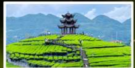
ไร่ชาอูโตเจีย