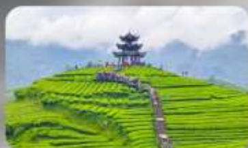
กูเขาไรซาอูเจียโก