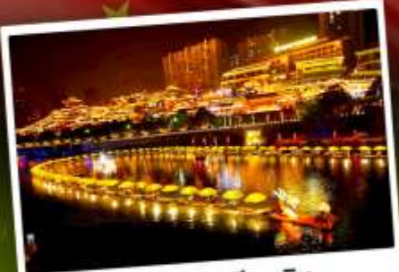
เมืองโบราณเซียนเอน